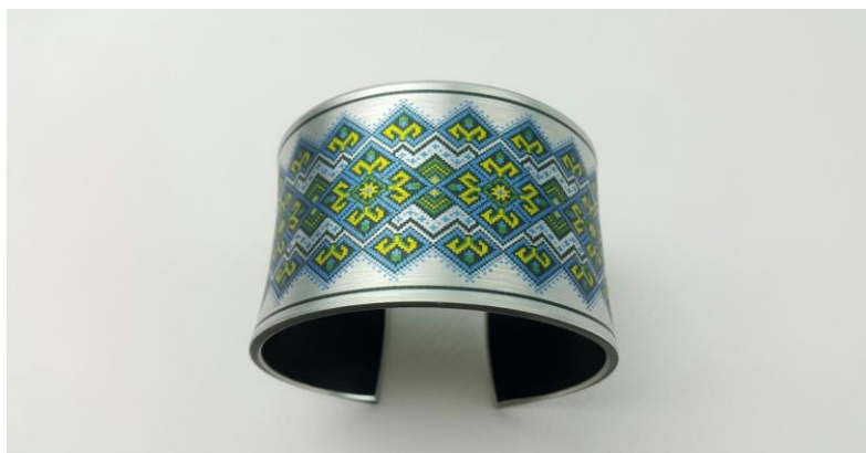
Фигура № 22: Гривна (бижу)