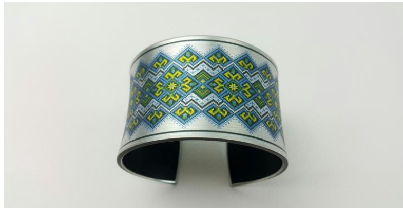
Figure 22: Bracelet (jewel)