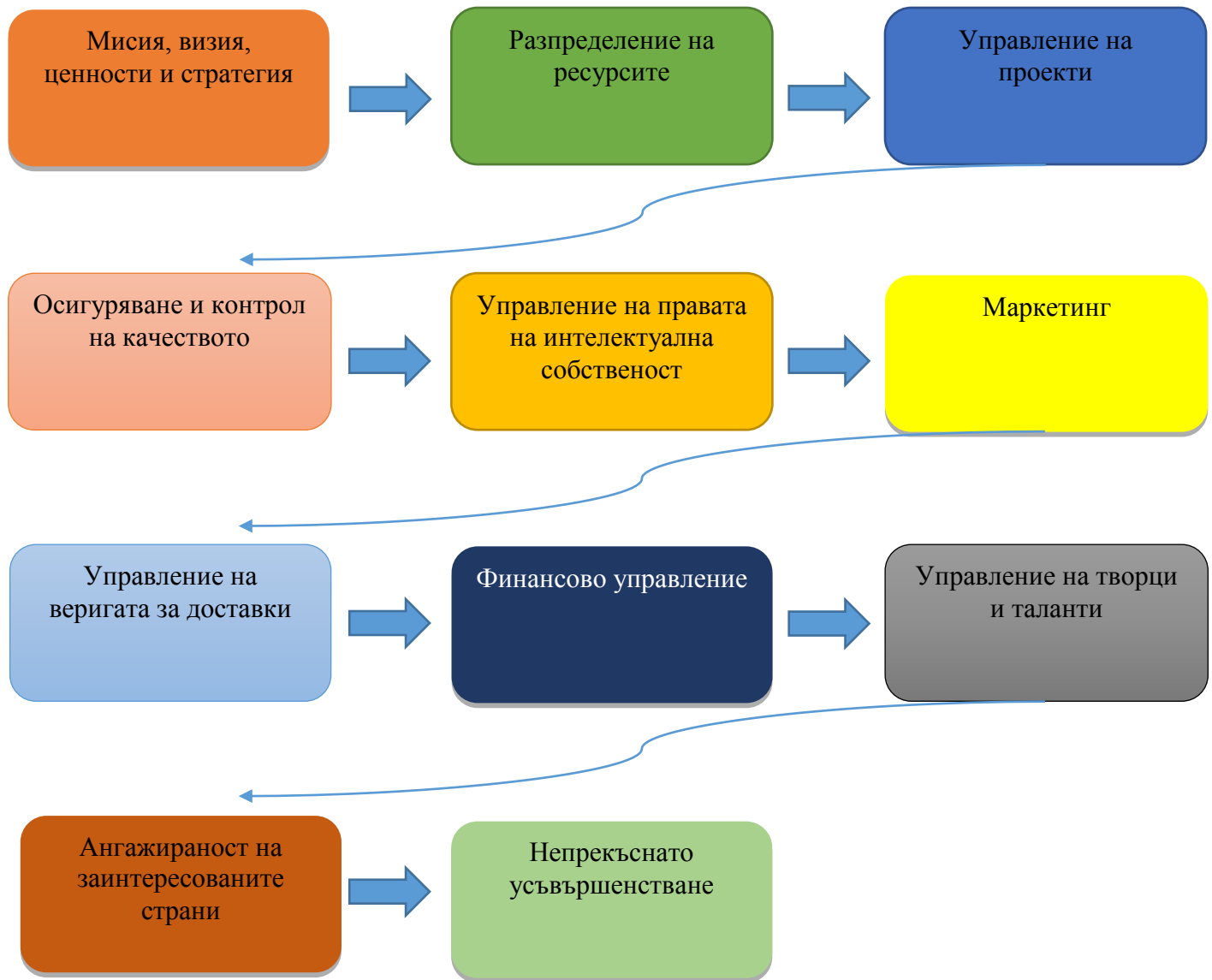
Фигура № 26: Модел за управление на произведения на приложните изкуства