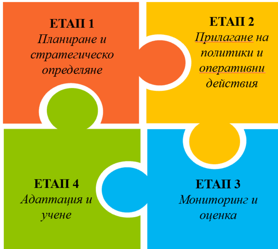
Figure 1 - Methodological Framework for the Management of Large Migration Flows presents the four stages of the framework. It visualizes the main points in the development of the methodological framework for large migration flows.