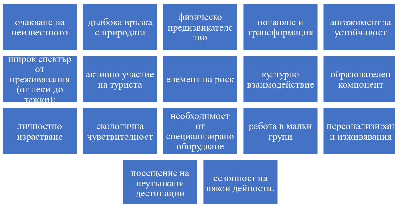
Фигура 1: Основни характеристики на приключенския туризъм

Във Фигура 1 са систематизирани основните характеристики на приключенския туризъм: