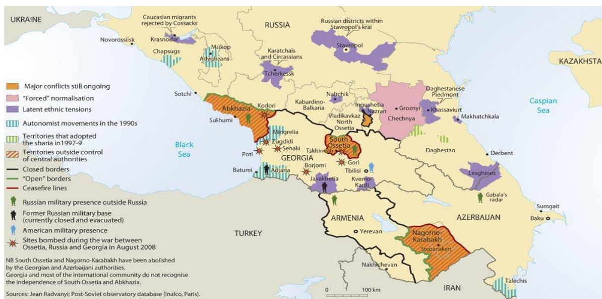
Карта 1. Карта на конфликтите в Южен Кавказ 6

Регионът е особено подходящ за изучаване на многобройните причини за възникване на ЕПК, както и липсата на такива, защото се отличава с разнообразие от етнически